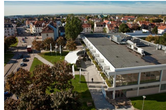
Gebäude 5107 Gastronomie und Konferenzbereiche