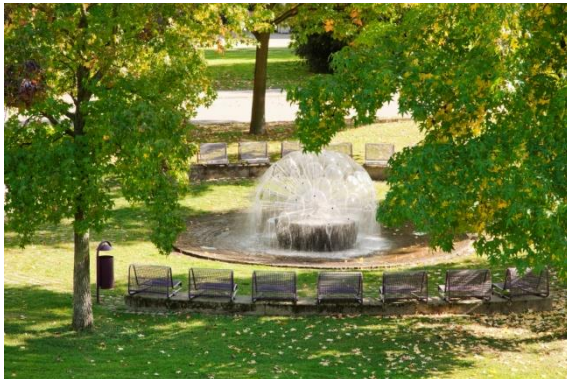
Parkanlage mit Springbrunnen „Park der Nationen“