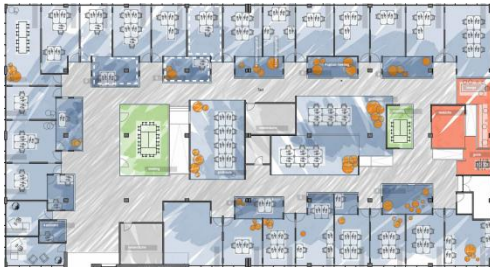
Bsp. Grundriss Gebäude 5112, 2.OG