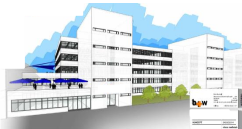
Bsp. Außenansicht Gebäude 5112 und 5111