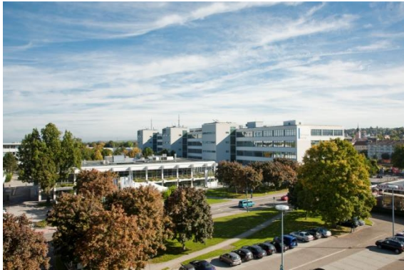
Gebäude 5107 (Gastronomie und Konferenzbereiche) Im Hintergrund die Gebäude 5110, 5111 und 5112