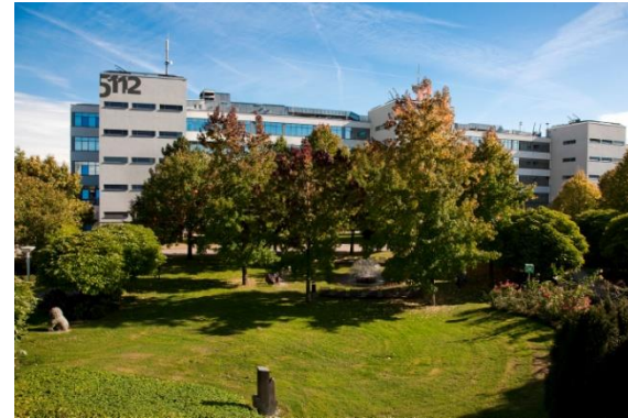
Gebäude 5110, 5111 und 5112